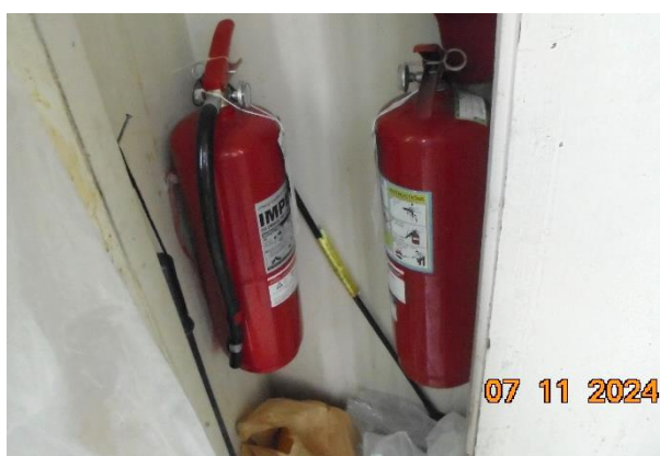
รูปที่ ก-15 หัวจ่ายน้ำดับเพลิงและอุปกรณ์ป้องกันอัคคีภัยเบื้องต้น