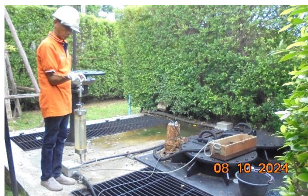
รูปที่ ก-12 การเก็บตัวอย่างน้ำก่อนและหลังการบำบัดไปทำการตรวจวิเคราะห์ในห้องปฏิบัติการ