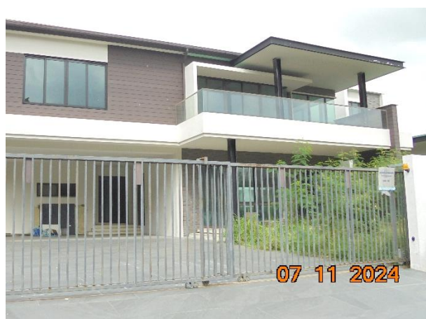
รูปที่ ก-1 โครงการก่อสร้างตามแบบ และจัดภูมิทัศน์ที่เหมาะสม