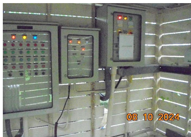
ระบบบำบัดน้ำเสียรวม 3