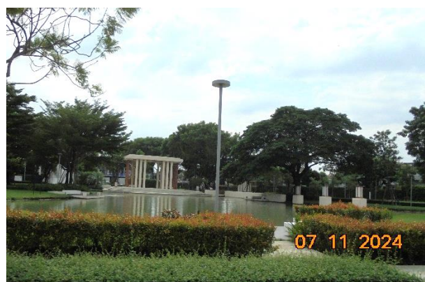
รูปที่ ก-13 ป่อหนองน้ำในโครงการ