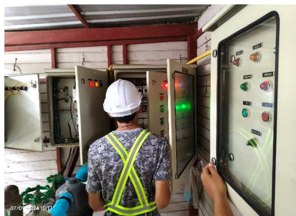
ระบบบำบัดน้ำเสียรวม 2