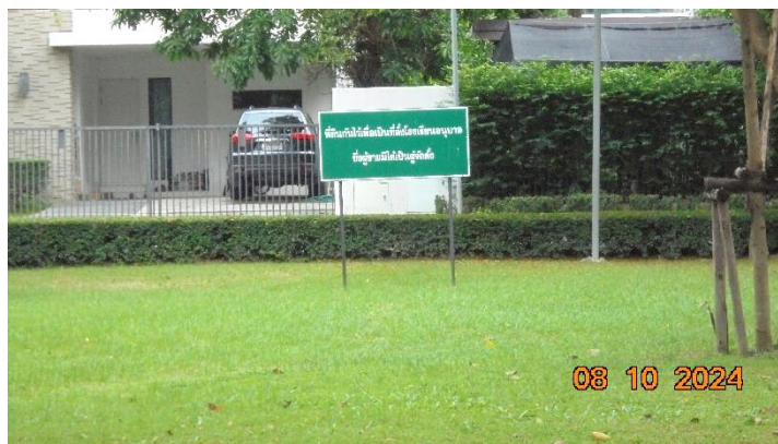
รูปที่ ก-11 แปลงที่ดินโรงเรียนอนุบาล (ปัจจุบันยังไม่ก่อสร้าง)