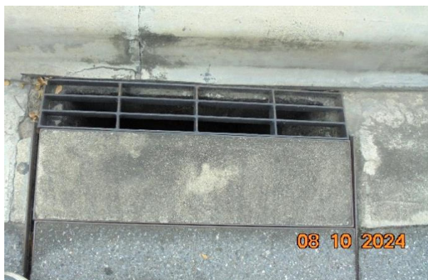
รูปที่ ก-14 ตะแกรงดักเศษขยะ