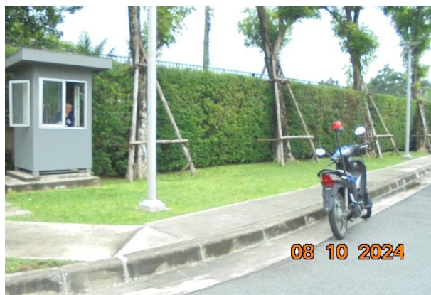
รูปที่ ก-8 การรักษาความปลอดภัยในพื้นที่โครงการตลอด 24 ชั่วโมง