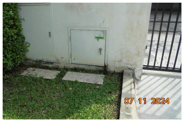
ถังขยะบ้านพักอาศัย