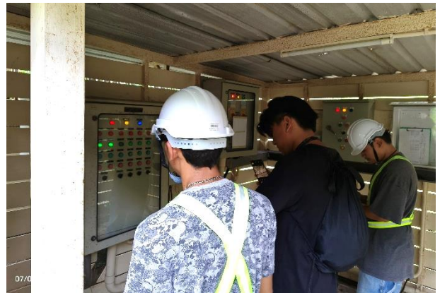
ระบบไฟฟ้าและคู่มือการเดินระบบบำบัดน้ำเสีย