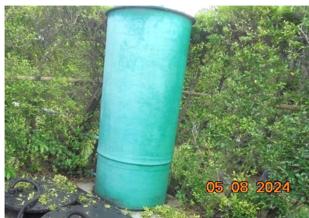
ถังดักละอองฝอย