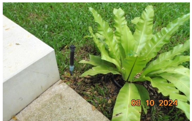
รูปที่ ก-6 น้ำที่ผ่านการบำบัดนำมาใช้รดน้ำต้นไม้บนพื้นที่สีเขียวโดยใช้ระบบสปริงเกอร์